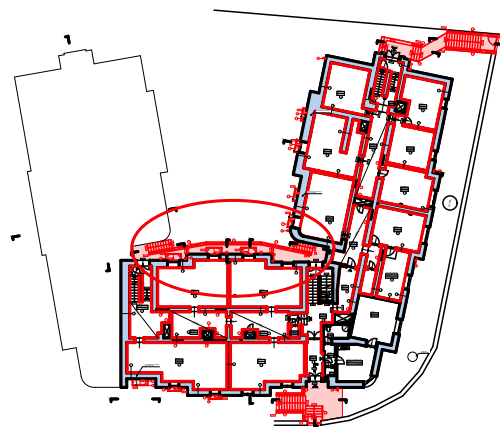
Řez S5 - S5'